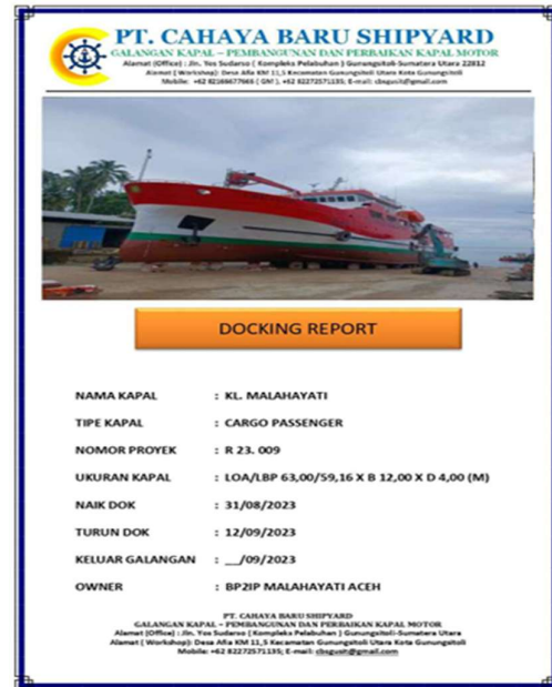
Gambar 4. Laporan Dock Report

dengan inspeksi lapangan, uji material, dan pengecekan sistem; 2) Administratif dalam pelaporan harian, dokumentasi foto, serta rapat koordinasi dengan Pihak Galangan; dan 3). Regulator untuk memastikan seluruh proses sesuai aturan klasifikasi kapal dan peraturan pelayaran nasional maupun internasional.